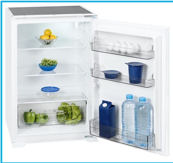
EKS 131-4.2 RVA+