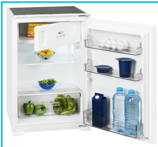
EKS 131-4.2 A+